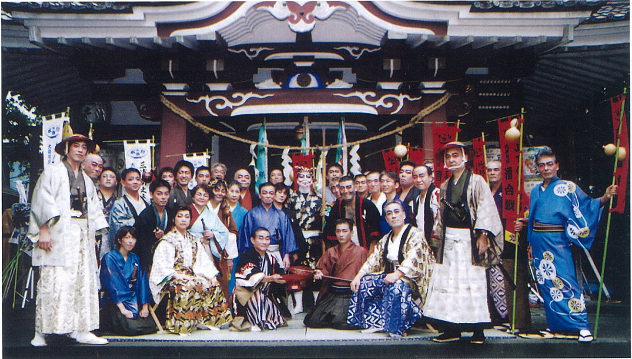
酒合戦 (若宮八幡宮)